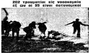
Απαγορεύεται ή δημοσίευσις άνωικητικών ήληροφοριών