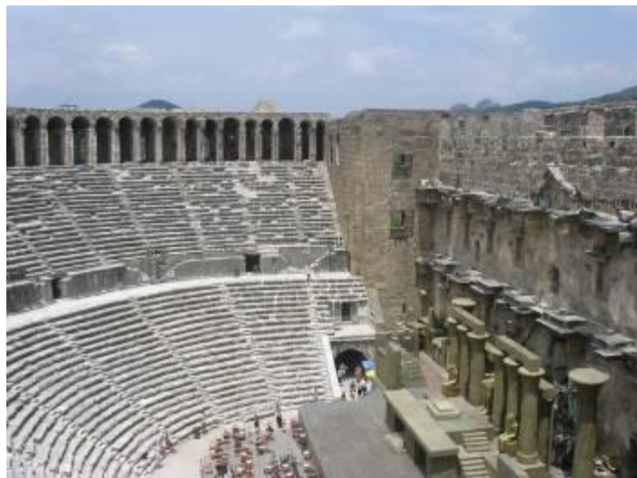
Το αρχαίο θέατρο στην Άσπενδο της Μ. Ασίας

Έτσι το θέατρο, έγινε απαραίτητος κοινωνικός θεσμός και κάθε πόλη, από τη Δύση και τις άλλοτε ελληνικές αποικίες στη Νότια Ιταλία και τη Σικελία, έως την Ανατολή και την ελληνιστικά βασίλεια της Ασίας, απέκτησε το δικό της