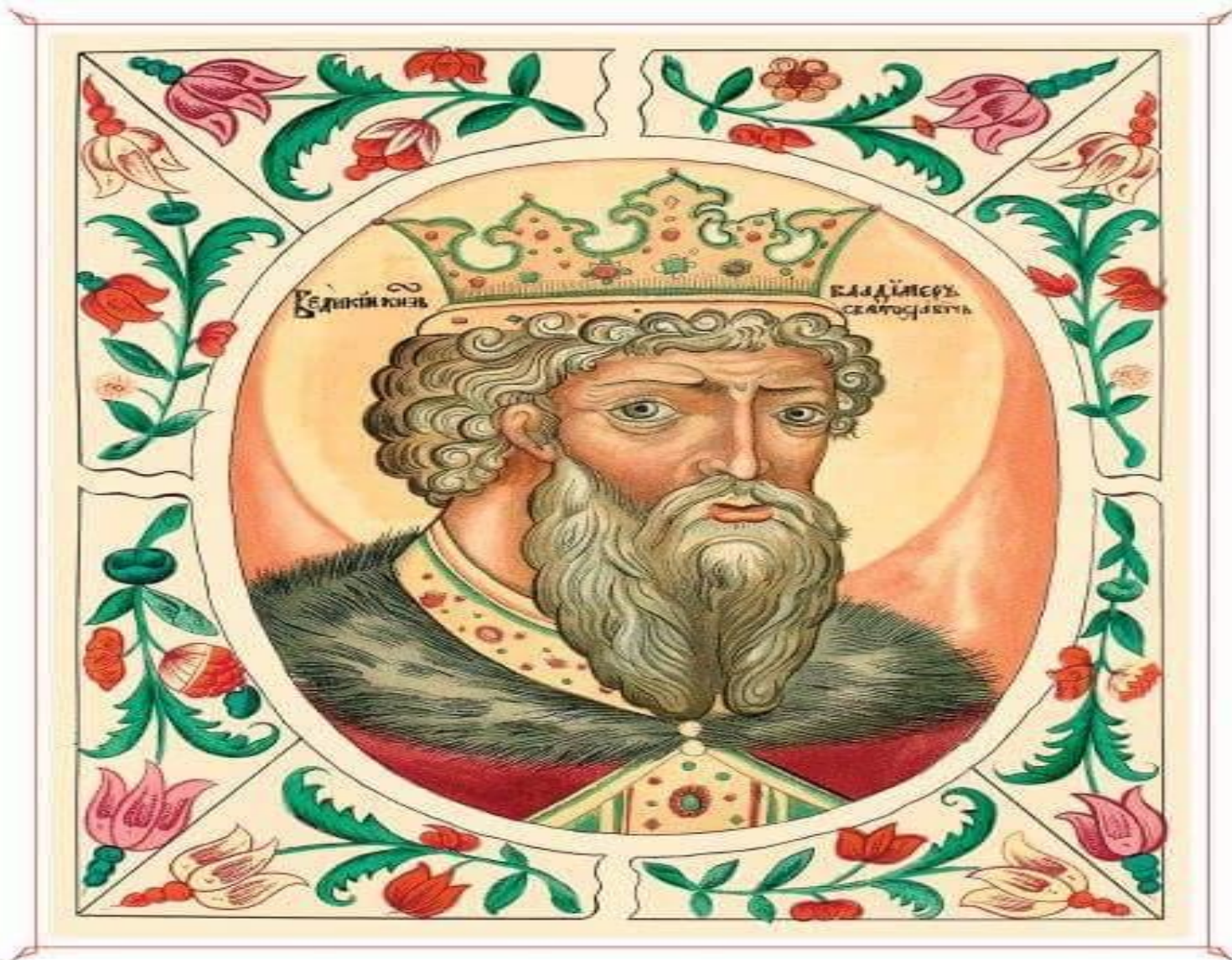
Ο Βλαντίμιρ Α'