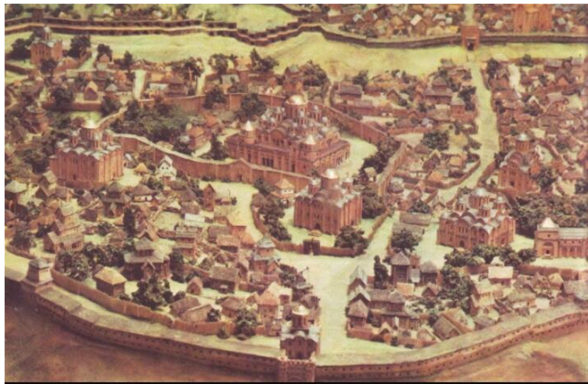
Το Κίεβο στα χρόνια του μεσαίωνα