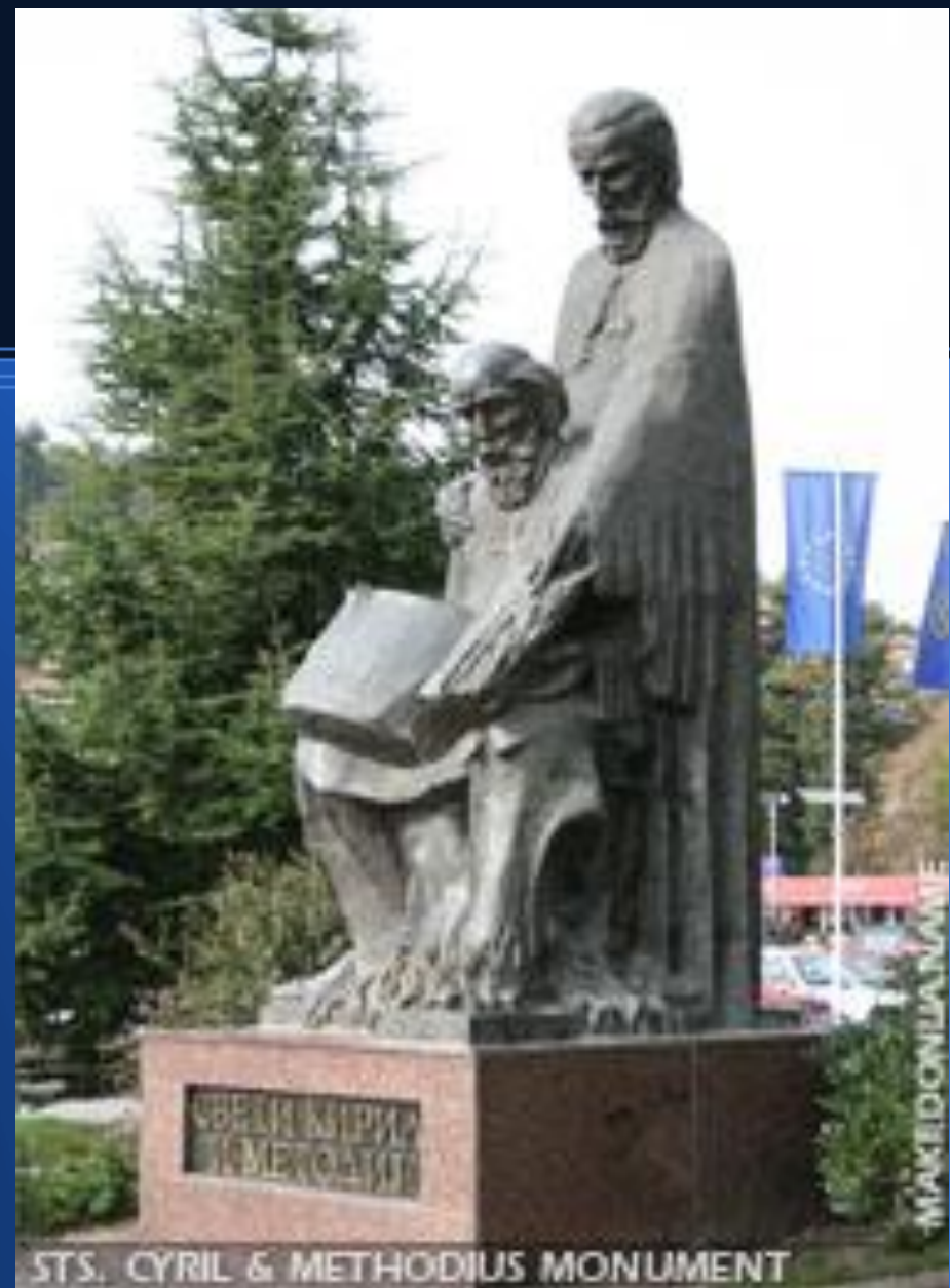
STS. CYRIL & METHODIUS MONUMENT