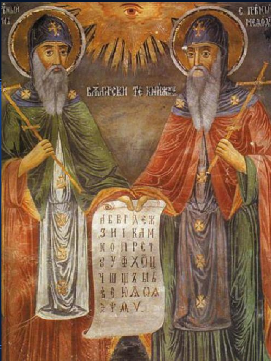
Εικόνα του βούλγαρου αγιογράφου Zahari Zograf (1810 – 1853 μ.Χ.) [μοναστήρι Trojan (1848 μ.Χ.)]