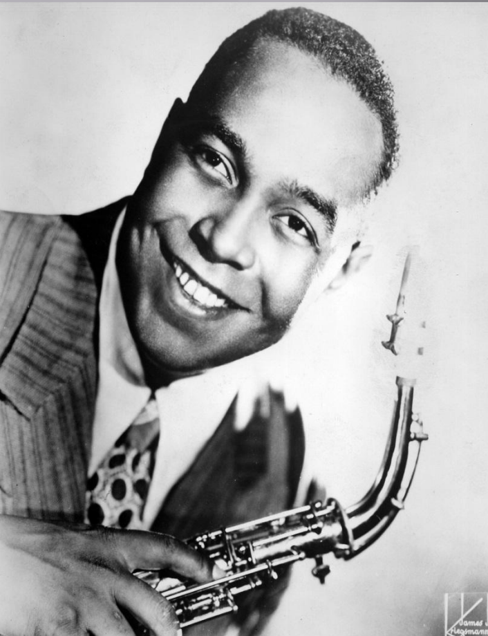
Charlie Parker, from "Celebrating Bird - The Triumph of Charlie Parker"

Υπήρξε ένας από τους σημαντικότερους αфроαμερικανούς της τζαζ, συνθέτης και άλλο σαξοφωνίστας. Η επίδραση του στην εξέλιξη της τζαζ θεωρείται πολύ σημαντική, ενώ συνέβαλε καθοριστικά, μαζί με τον Ντίζι Γκιλέσπι. Συχνά αναφέρεται και με το ψευδώνυμο Bird ή Yardbird το οποίο απέκτησε στα πρώτα χρόνια της καριέρας του και το διατήρησε μέχρι το τέλος της. Σημαντικό να αναφερθεί είναι ότι στις 29 Ιουνίου του 1946 νοσηλεύτηκε σε νοσοκομείο λόγω νευρικής κατάρρευσης και του εθισμού του στην ηρωίνη και στο αλκοόλ. Η παραμονή του στο νοσοκομείο διήρκεσε 6 μήνες και στην συνέχεια επανήλθε στα μουσικά δρώμενα. Στα τελευταία χρόνια της ζωής του, σε κακή οικονομική κατάσταση και με προβλήματα υγείας εξαιτίας των καταχρήσεων ουσιών, αποπειράθηκε να αυτοκτονήσει δυο φορές (1954), ενώ εισήχθη και στο ψυχιατρικό νοσοκομείο της Ν.Υ. Πέθανε σε ηλικία 34 ετών στο Μανχάταν, από πνευμονία στις 12 Μαρτίου 1955