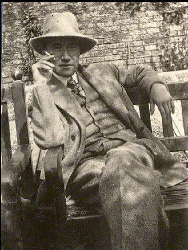
Ο Αντρέ Ζιντ το 1920.

Ο Αντρέ Ζιντ γεννήθηκε στις 22 Νοεμβρίου 1869 στο Παρίσι. Ήταν Γάλλος μυθιστοριογράφος, δοκιμιογράφος και θεατρικός συγγραφέας.