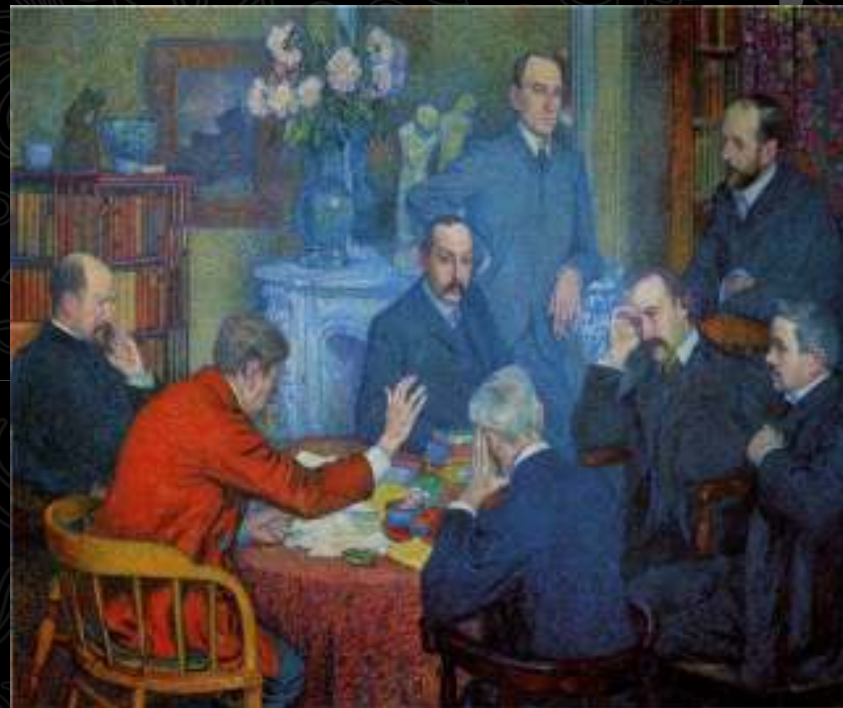
Τεό Βαν Ρυσσελμπέργκε, Η διάλεξη. Ο συγγραφέας εμφανίζεται καθισμένος δεξιά.

Παντρεύτηκε μια ξαδέλφη του, την Μαντλέν Ροντώ. Το 1916 δημιούργησε ερωτική σχέση με τον μετέπειτα σκηνοθέτη Μαρκ Αλλεγκρέ, γιο στενού φίλου του. Το 1923 αποκτά το μοναδικό παιδί του με την Ελίζαμπετ βαν Ρύσσελμπέργκε, κόρη του Βέλγου ζωγράφου Τεό βαν Ρύσσελμπέργκε, φίλου του επίσης. Έκανε πολλά ταξίδια στην Αφρική, όπου και ανακάλυψε το γυναικείο φύλο.