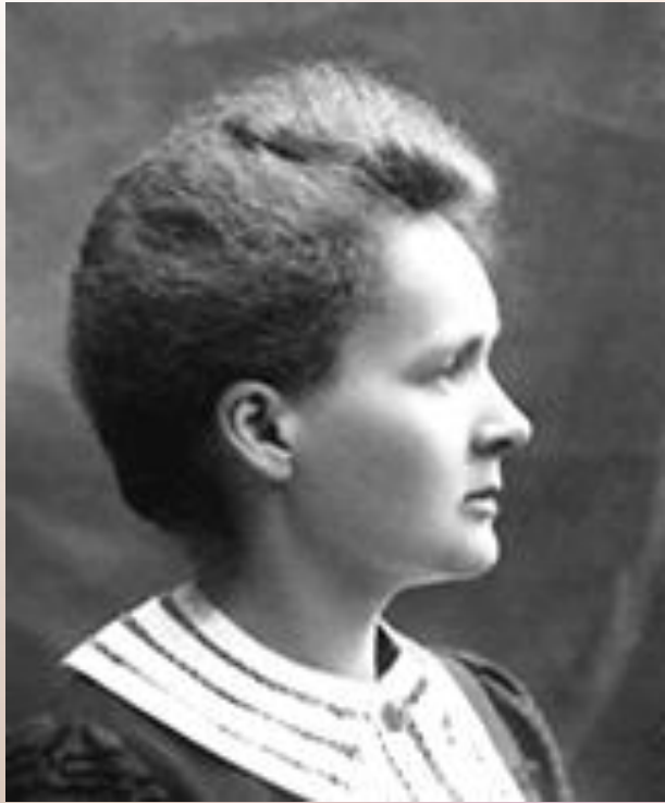
Μαρία Κιουρί (1867– 1934)

«Πρέπει να έχουμε επιμονή και πάνω απ' όλα εμπιστοσύνη στους εαυτούς μας.»