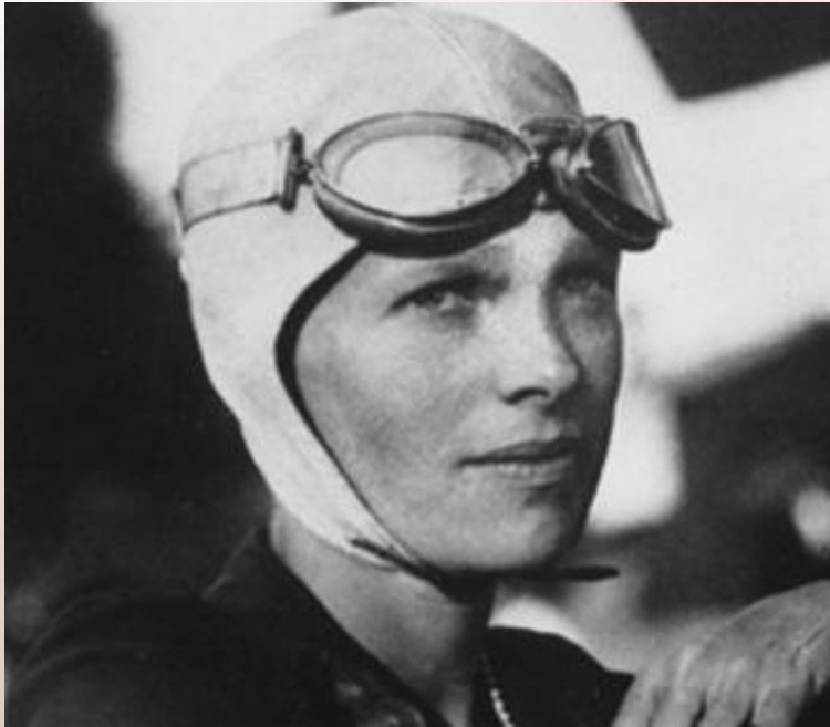
Αμέλια Έρχαρτ ( 1897-1939)

Η περιπέτεια είναι από μόνη της ανταμοιβή.