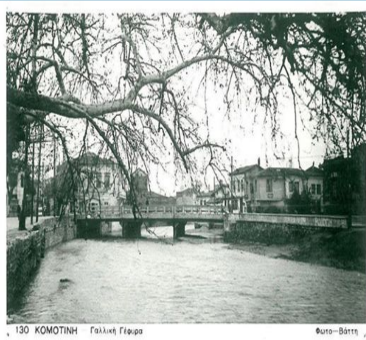
130 ΚΟΜΟΤΙΝΗ Γαλλική Γέφυρα

Η ιστορία της ξεκινάει από τα τελευταία χρόνια του Βυζαντίου. Τότε η Θράκη ήταν διάσπαρτη με οχυρά κατά μήκος της Εγνατίας Οδού.